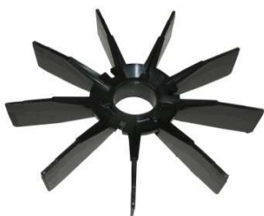
Lüfterflügel BR200 Art.Nr: 3300183