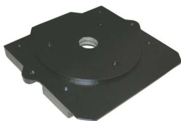
Motorflansch BR200 Art.Nr: 3103111