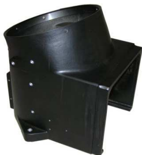
Gehäuse schräg Art. Nr: 3800104