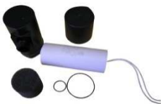
Kondensator mit Kondensatorrohr Dichtungen, Klammer, Komplett Anschluss eckig Art.Nr.: 3300215