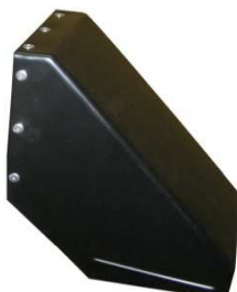
Auswurf ohne Blech Art. Nr: 3100400