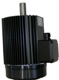
Motor Art.Nr: 3110305