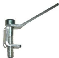
Kegelstop Art.Nr.: 80091