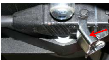
Wiedereinschaltsperr Biegel Art. Nr:3800103