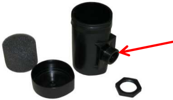
Kondensatorrohr mit Schaumstoffeinsatz und Deckel Anschluss rund Art.Nr.: 3310222