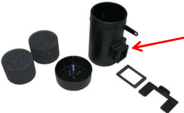
Kondensatorrohr mit Schaumstoffeinsatz und Deckel Anschluss eckig Art.Nr.: 3310219