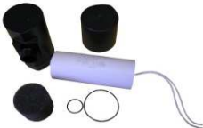
Kondensator mit Kondensatorrohr Dichtungen, Mutter, Komplett Anschluss rund Art.Nr.: 3300214